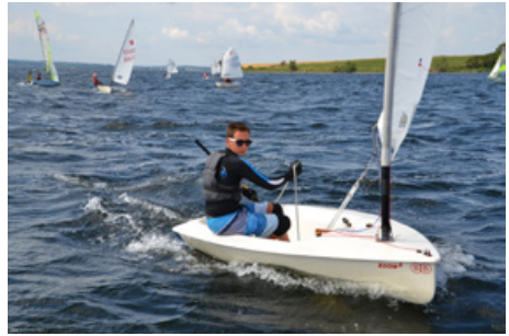
Zoom 8 jolle