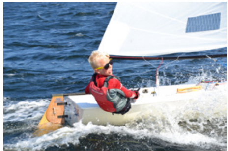
... og med et smil på læben!