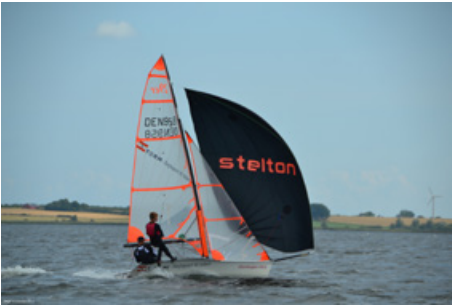
20'er fra HVS