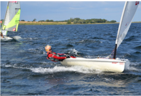
Hu, Hej hvor det går!