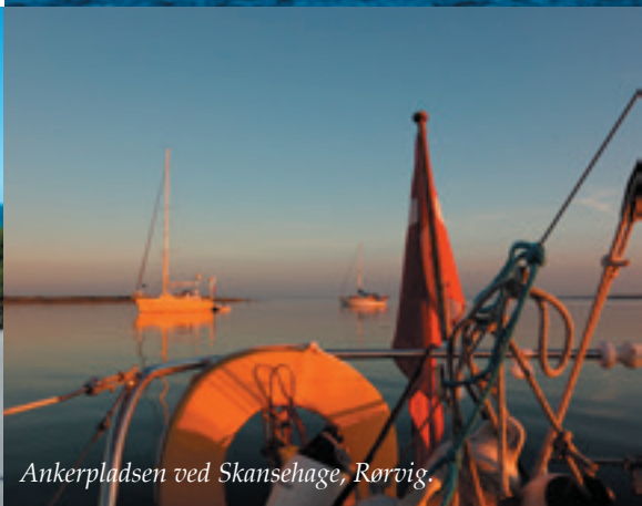
Ankerpladsen ved Skanseshage, Rørvig.