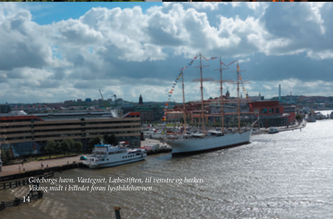
Göteborgs havn. Vartegnet, Læbestiften, til venstre og barken Viking midt i billedet foran lystbådehavnen.