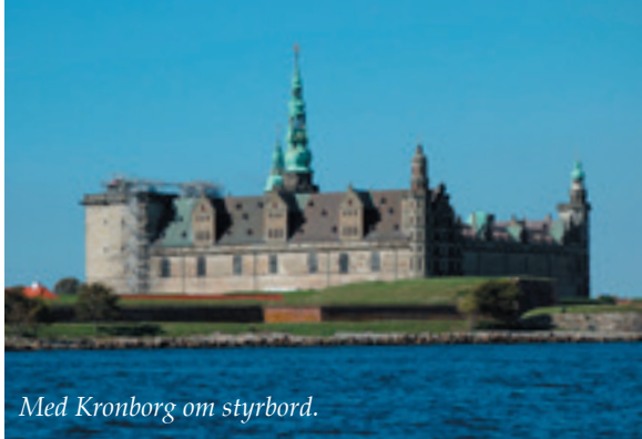
Med Kronborg om styrbord.

Her er billeder fra den sidste del af Tjaldurs sommertur i 2014, - billeder, som vi ikke fik plads til i sidste nr.