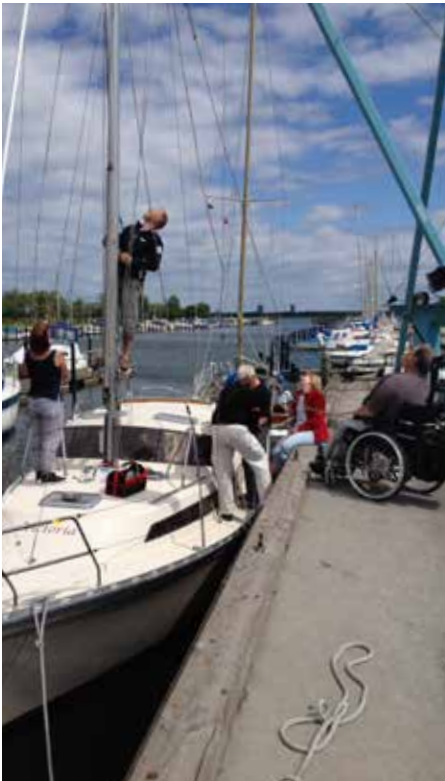
Hvordan får man mastestropen ned igen?