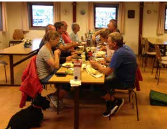
Tyststart af hygge - fredag!

"Til Pinse gider vi ikke spise linse og alle fra Suset ender altid beruset"