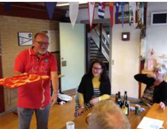
Mesterskab i æbleskræling