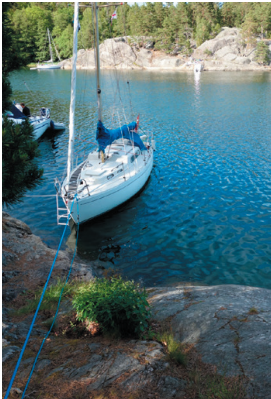
Napoleonsviken nær Stockholm. Tjaldur fortøjet til klippen.