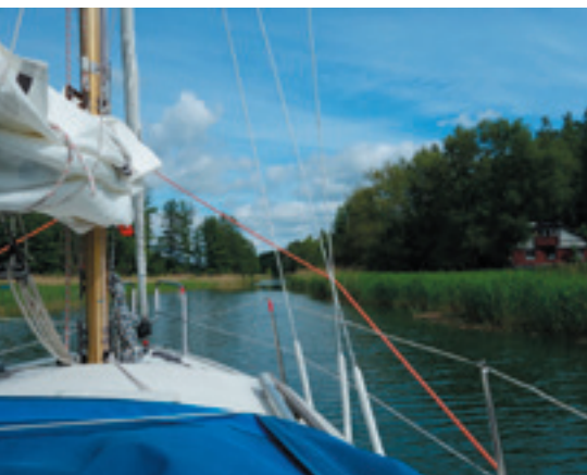
Ad snævre vandveje gennem Stockholms skærgård