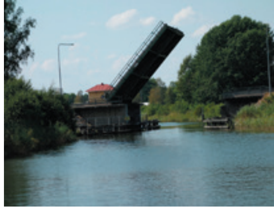
Götakanalen, en af de utallige broer åbner.