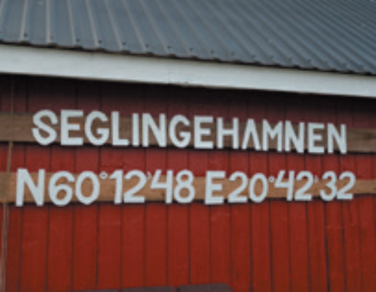
Seglinge ligger mod NØ ved Kumlinge på Ålandsøerne.