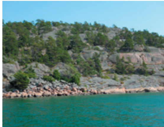
Vi sejler sydpå ved Geta på det nordvestlige Åland.