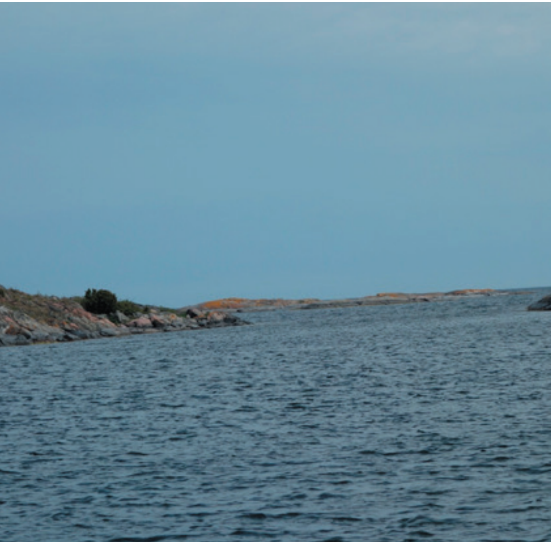
Grimme skær ved indsejlingen til Figeholm, der ligger på højde med Ölands nordspids.

Vi har sejlet i ca 3½ måned og taget godt 2.000 billeder, så det er helt umuligt at illustrere andet end nogle få steder fra denne fantastiske tur. Og det gør vi så med de her viste billeder.