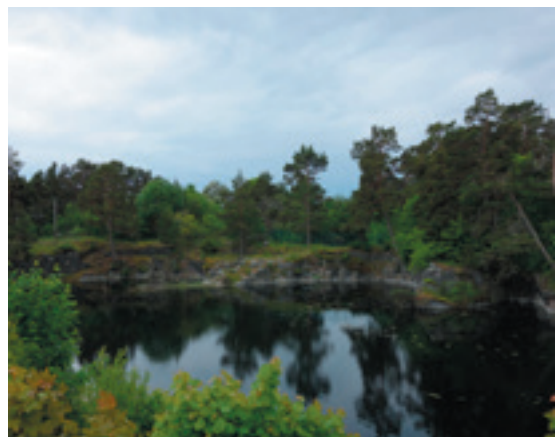
Utdö ud for Nynäshamn. Gamle jernmalmgubere, op til 200m dybe.