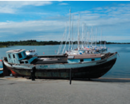
Sandvik gästhamn på Kökar, Ålands sydøstligste ø.